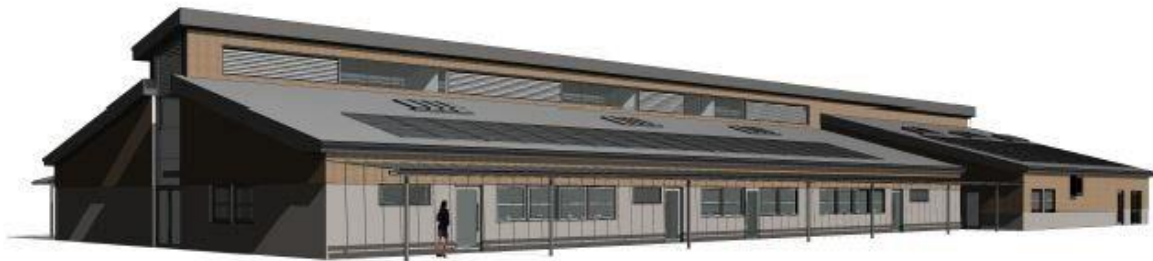
3D View - From Playing Field